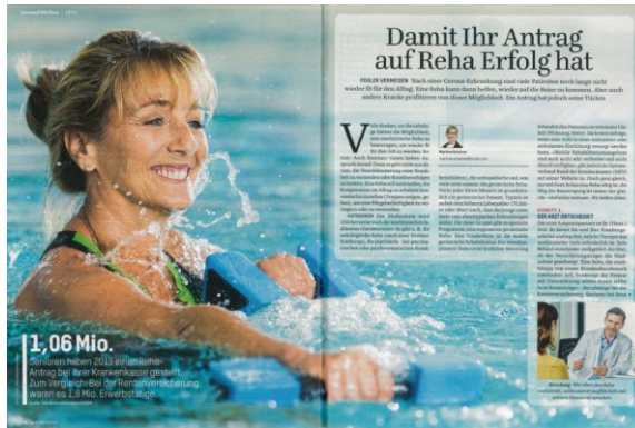
Guter Rat, Ausgabe 08/21