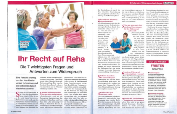
Pflege & Familie, Ausgabe 2/20