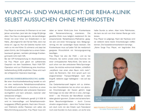
COSMOS Gräfl. Kliniken, Ausgabe 10/21